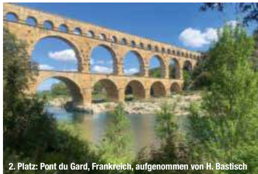
2. Platz: Pont du Gard, Frankreich