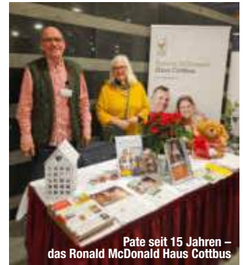
Pate seit 15 Jahren – das Ronald McDonald Haus Cottbus

beteiligte, und landete mit dem korrekten Lösungswort BISTROBUS zudem in der Lostrommel. Die Qualität der Wahl hatten alle, die beim Fotowettbewerb aus den 72 Beiträgen ihre Favoriten bestimmten. Das Urlaubskino im großen Saal bot manche Reiseinspiration und fand ebenso regen Anklang. Und es durfte geschätzt werden, wie viel so ein vollgepacktes Reisegepäck wie-