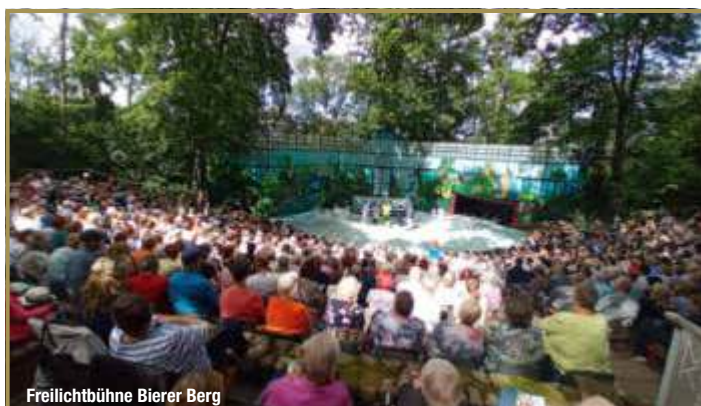
Freilichtbühne Bierer Berg