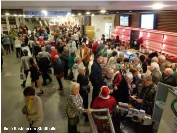
Viele Gäste in der Stadthalle

Ein kurzer Rückblick auf die 17. RCC-Reisegala & 7. RCC-Reisemesse