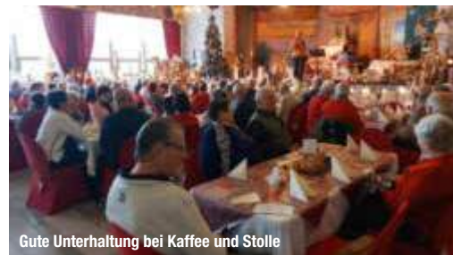
Gute Unterhaltung bei Kaffee und Stolle

Nach diesem schönen unterhaltsamen Nachmittag mussten wir leider wieder die Heimreise antreten.