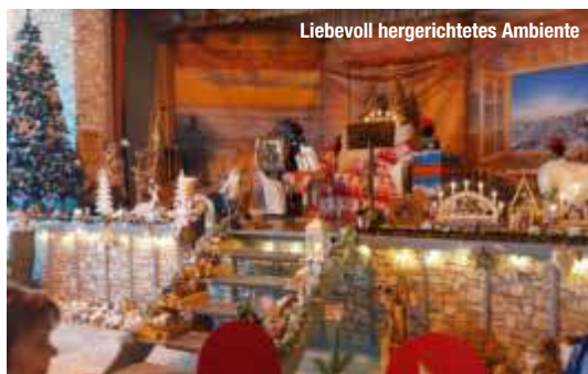
Liebevoll hergerichtetes Ambiente