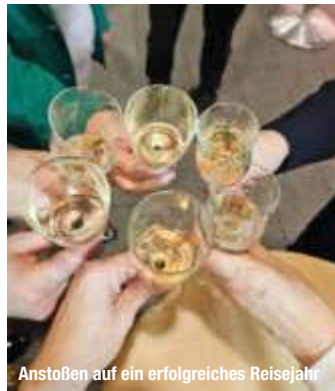
Anstoßen auf ein erfolgreiches Reisejahr

Festung Königstein oder den Friedrichstadtpalast bis hin zu Reisegutscheinen für eine Premium-Reise aus dem RCC-Programm oder eine Flusskreuzfahrt wurden an diesem Wochenende Preise im Wert von mehr als 5.500 Euro ausgegeben. Da sagen wir doch gern noch einmal: Herzlichen Glückwunsch an alle Gewinner!