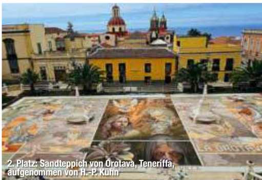
2. Platz: Sandteppich von Orotava, Teneriffa, aufgenommen von H.-P. Kürin