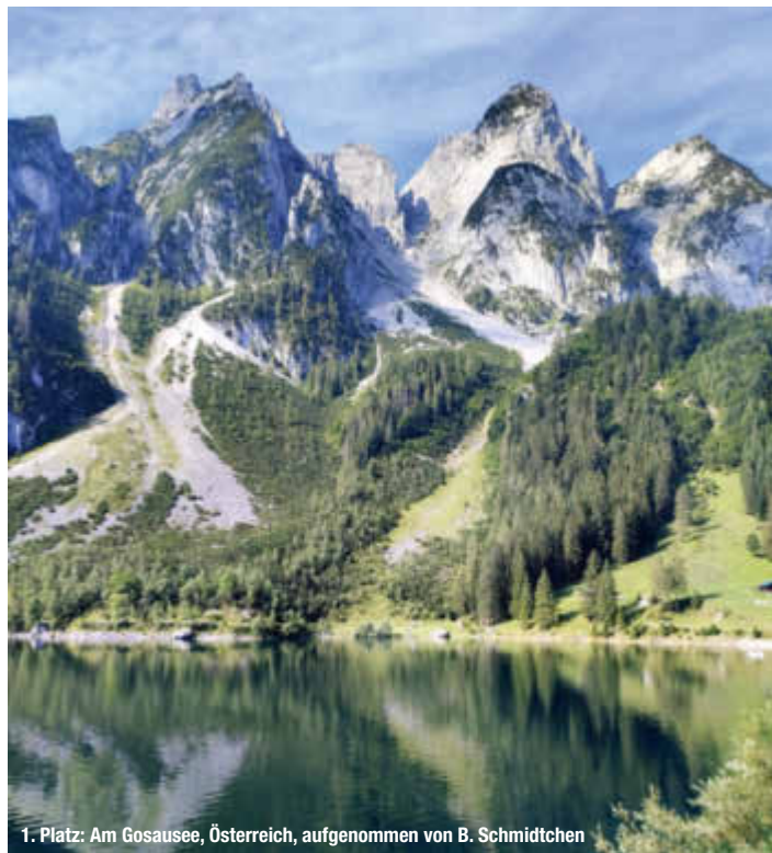
1. Platz: Am Gosausee, Österreich, aufgenommen von B. Schmidtchen

Wir sagen: Herzlichen Glückwunsch an alle Gewinner und vielen Dank an alle, die sich einerseits mit ihren Fotos am Wettbewerb beteiligt und die andererseits ihre Stimme abgegeben haben.