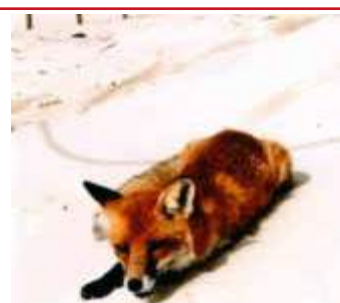
Fototeilnehmer 2025: Das RCC-Maskottchen in den Wanderdünen von Łeba

oder geben Sie es im RCC-Reisebüro in Ihrer Nähe ab.