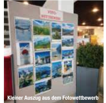
Kleiner Auszug aus dem Fotowettbewerb

Zu unserer Hausmesse am darauffolgenden Sonntag strömten ebenfalls unzählige interessierte Besucher zur und in die Stadthalle. Schon auf dem Vorplatz standen einige Busse unserer Flotte zur Besichtigung und einem ersten „Probefahren“ bereit. Auch „Probefahren“ an den Cottbuser Ostsee oder quer durch die Lausitzmetropole war möglich und die verfügbaren Tickets für diesen Tag nahezu ausverkauft. Innerhalb des Hauses schwirrte in den Foyers auf beiden Ebenen derweil der bunte Messetrubel. Sein Wissen austesten konnte jeder, der sich an unserem Kleinen Reisequiz