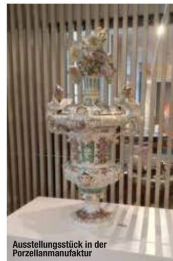
Ausstellungsstück in der Porzellanmanufaktur