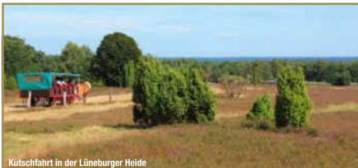
Kutschfahrt in der Lüneburger Heide