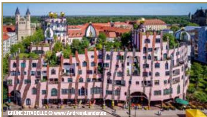
GRÜNE ZITADELLE