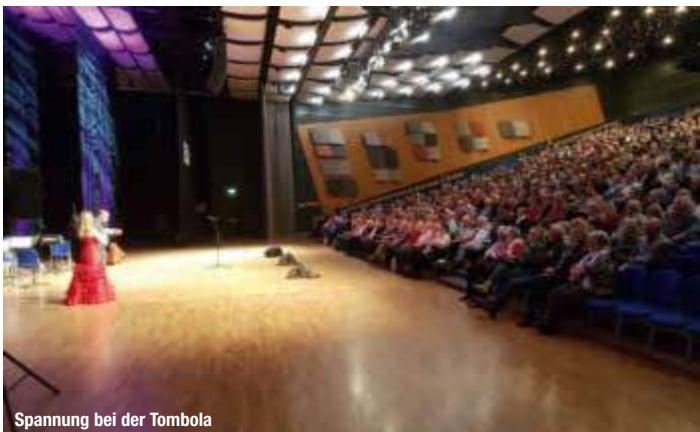
Spannung bei der Tombola

Nun ist unser Festwochenende schon wieder Geschichte. Schön war's und wir sind gespannt auf das nächste. Denn allen Unkenrufen – die das Aus für unsere Gala bedeutet hätten – zum Trotz werden wir uns im kommenden Jahr an alter Stelle wiedersehen. Wir freuen uns auf Sie!