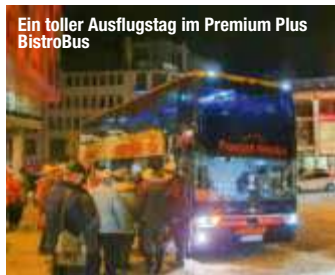
Ein toller Ausflugstag im Premium Plus BistroBus

Aus Richtung Weißwasser ging es am 7. Dezember 2024 geradewegs nach Meißen. Wir genossen die vorweihnachtliche Fahrt im vollbesetzten Premium Plus BistroBus übers Land und mit Weihnachtsmusik aus