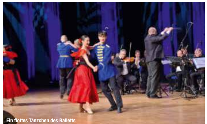
Ein flottes Tänzchen des Balletts