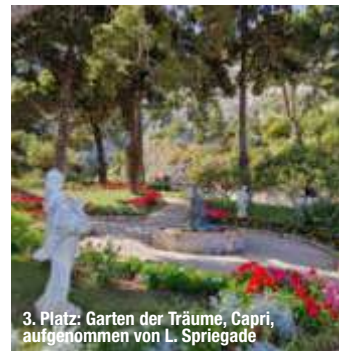
3. Platz: Garten der Träume, Capri